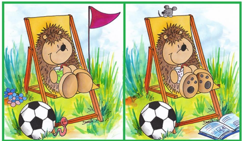
Daria Broda, knollmaennchen.de, in: pfarrbriefservice.de

Aber hoppla, da stimmt doch einiges nicht! Findet ihr die 7 Fehler auf dem rechten Bild?